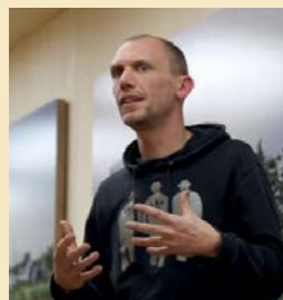
Sylvain Gouraud , photographe

« Écrire, c'est aussi changer de distance par rapport au monde : s'approcher au plus près des textures, des couleurs, des émotions, des sensations. La vie mystérieuse et lente des plantes est en soi une leçon d'écriture. Apprendre à les nommer, découvrir leurs propriétés, c'est aussi élargir le domaine du langage, ajouter des mots et des formes à son vocabulaire. L'écriture, comme le jardin, ne vient pas de rien. Il faut semer, entretenir, observer. Et souvent, la plante qui grandit ne ressemble pas à ce qu'on avait imaginé. »